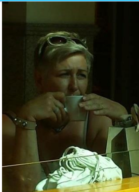
Tijdens de kerstviering op 22 december, wil ik graag van iedereen persoonlijk afscheid nemen. Tot dan!

Vanaf 1 januari 2002 werk ik op Laetare, 15 jaar. Dat lijkt een hele tijd maar het is omgevlogen. Heel wat uurtjes heb ik op deze fantastische school doorgebracht en altijd met veel plezier. Mijn vertrek is dan ook een heel grote stap voor mij persoonlijk. Ik laat immers een heel goede werkplek, fijne collega's, hartelijke ouders en enthousiaste kinderen achter. Toch heb ik na lang wikken en wegen besloten om deze stap te zetten.