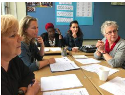
Fragment: werkvorm Vreedzame School

Wij hebben voor de herfstvakantie een goede studiedag gehad. Wij hebben in de ochtend aan de Vreedzame School gewerkt. In de middag is er gesproken over het geven van goede instructies en hoe het klassenmanagement nog beter vormgegeven kan worden.